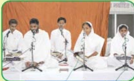
યુવાસાઘક ભક્તવૃંદ, કોબા