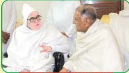
પૂજ્યશ્રી સાથે સત્સંગ વેળાએ