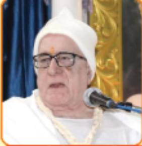
પૂજ્યશ્રીની પાવન મિશ્રા