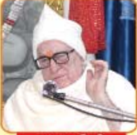
પૂજ્યશ્રીની પાવન નિશ્રા