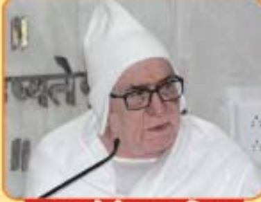
પૂજ્યશ્રીની પાવન નિશા