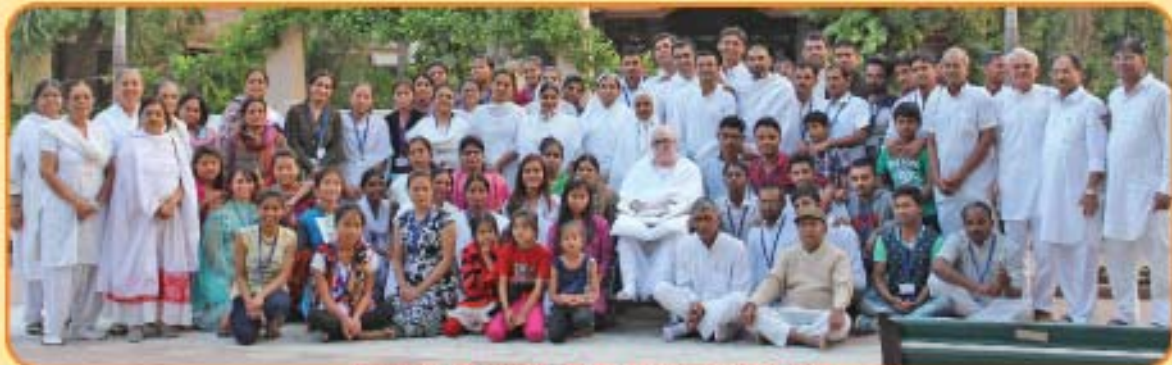
યુવા શિબિરાર્થીઓની સમૂહ તસવીર