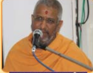
પૂ. અદારવત્સવ સ્વામીજી