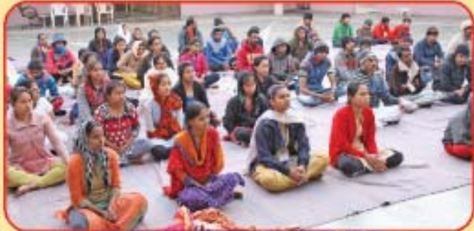
યોગાસન કરતા શિબિરાર્થીઓ