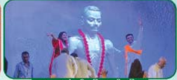
પરમકૃપાળુદેવની પ્રતિમાણુની પ્રતિષ્ઠા