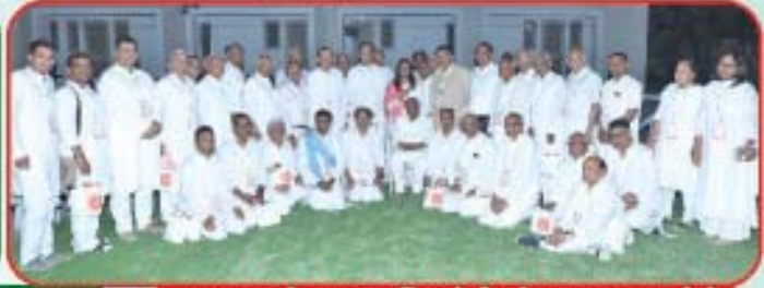
રાજઆશ્રમોના રાજપરિવારોની એકતાવૃષ્ટિ ગ્રુપ ફોટો