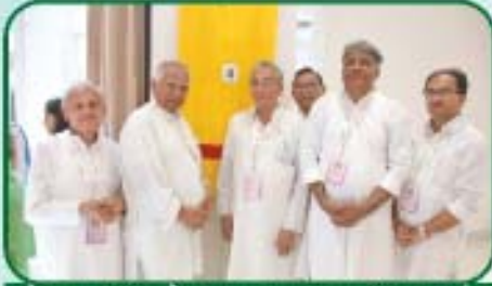
કેબાના મુમુક્ષુઓ દ્વારા વચનામૃતના આરસપટનું આયરણ