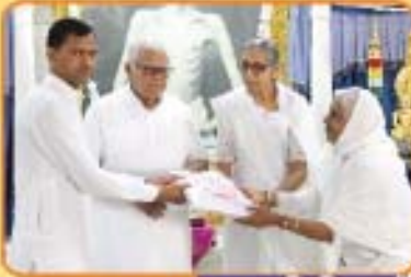
યુવા શિબિરાર્થીઓનું અભિવાદન